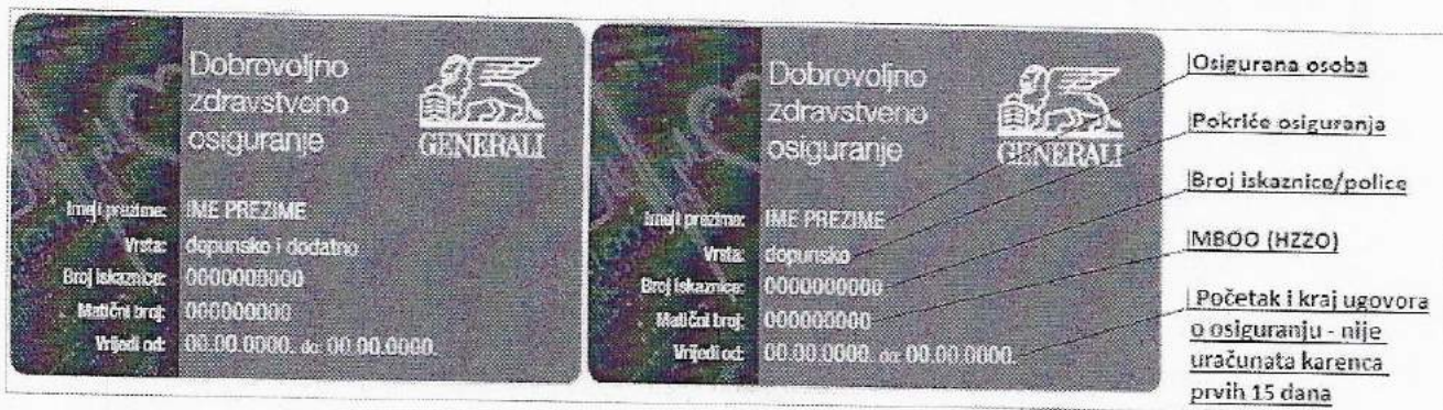
Slika 1 Primjeri kartica

Iskaznica ne smije biti oštećena ili vidno mijenjana. Broj iskaznice može imati 10 ili 15 znamenaka.