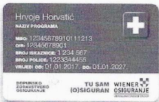
Iskaznica Wiener dopunskog osiguranja

https://www.wiener.hr/provjera-statusa-dopunskog-zdravstvenog-osiguranja.aspx