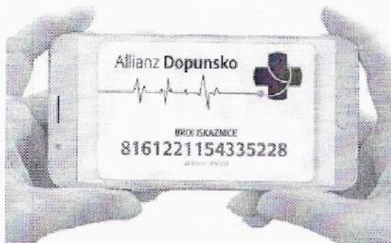
Digitalna iskaznica Allianz dopunskog osiguranja

Pacijenti kao sredstvo plaćanja mogu koristiti digitalnu iskaznicu Allianz dopunskog osiguranja.