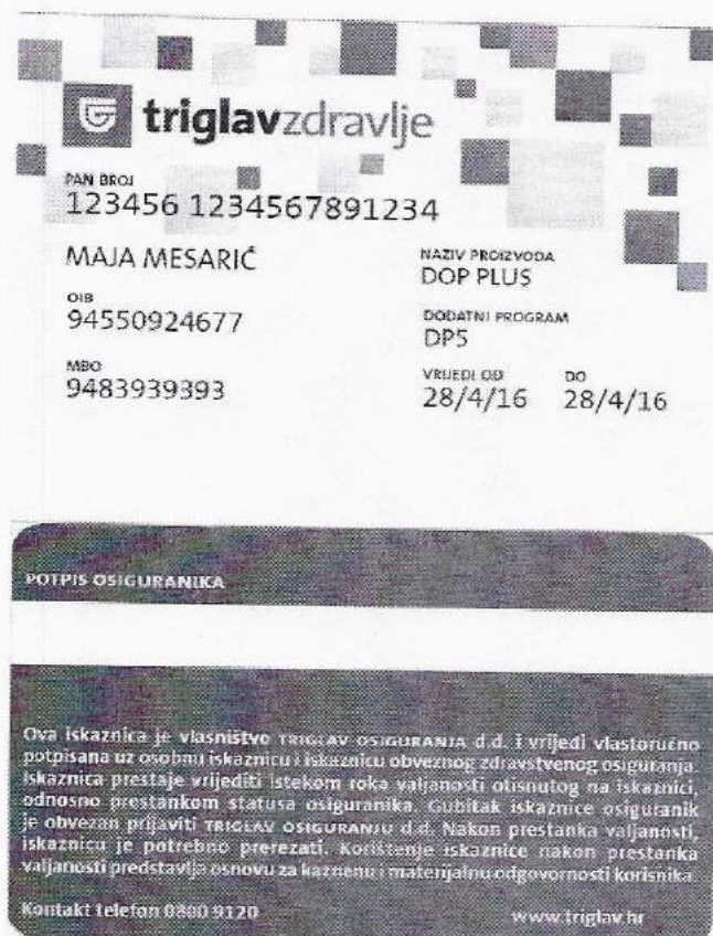
Iskaznica Triglav dopunskog osiguranja

Status osiguranika Triglav osiguranja prilikom korištenja zdravstvene zaštite dokazuje se važećom iskaznicom koje je izdalo Triglav osiguranje. Valjanost osiguranja moguće je provjeriti telefonski, putem kontakt centra (0800 9120) ili elektronski koristeći odgovarajuću tehnologiju kada Triglav osiguranje istu stavi na raspolaganje.